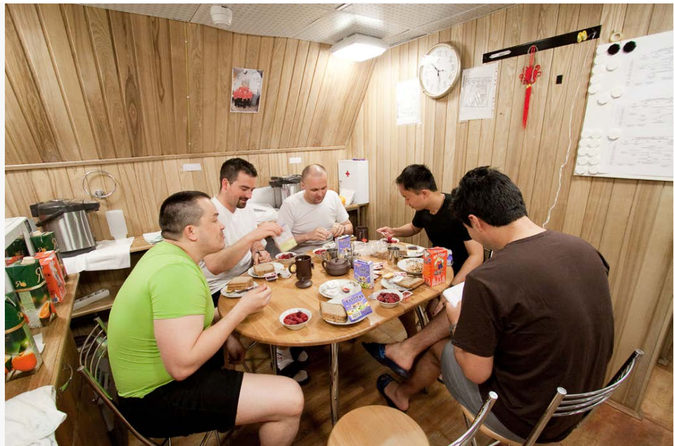
MARS500 ארוחת ערב במהלך פרויקט

הדלתות נפתחו ביום שישי, 4 בנובמבר, בשעה 14:00 שעות מוסקווה והאסטרונאוטים ימצאו מהרכב שלהם ונופפו למנהלי המשימה. לאחר הטעימה הראשונה מהחופש, הם הובלו לפגישה עם רופאים ועם בני משפחותיהם וחבריהם הקרובים. טוב לראות אתכם שוב" אמר דייגו אורבינה, נציג איטליה וסוכנות החלל האירופית בצוות המבצע לאחר היציאה.