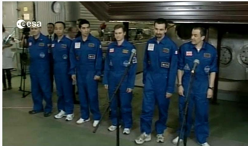
יוצאים מתא ההדמיה שלהם לאחר כשנה וחצי, 4/11/2011. צילום: סוכנות החלל MARS500 חברי צוות משימת האירופית

בסוכנות החלל האירופית שהיתה שותפה ביחד עם סוכנות החלל הרוסית בפרויקט מרוצים מהתוצאות, במיוחד מהלכידות החברתית של אנשי הצוות