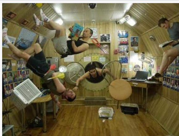
היה MARS500 הדבר היחיד שהיה חסר במשימת ההדמיה למאדים המיקרו כבידה בחלל האמיתי. לפחות הצליחו לעשות זאת באמצעות עיבוד תמונה לרגל ה-1 באפריל.

"השגנו את הדמית משימת החלל הארוכה ביותר שהאנושות תוכל לבצע כדי לקדם שחר חדש במרחק של Mars500 במשימת" "כוכב לכת בר השגה