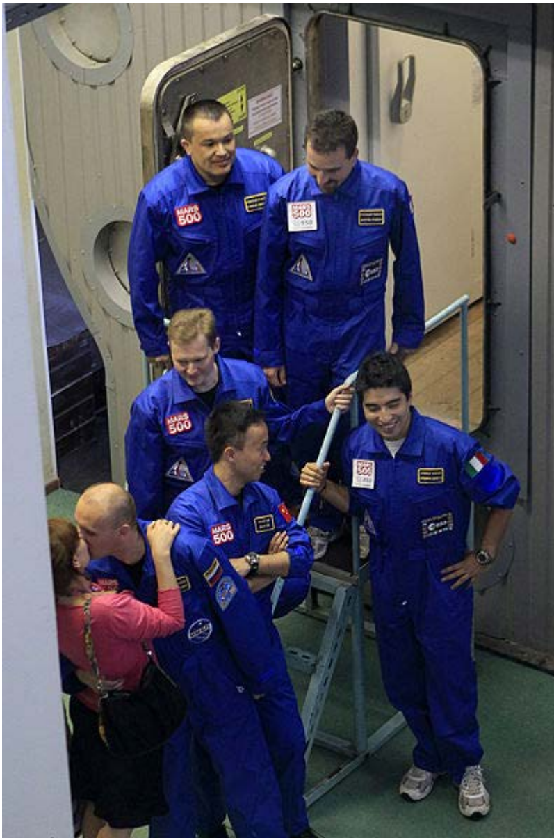
Posádka po ukončení experimentu